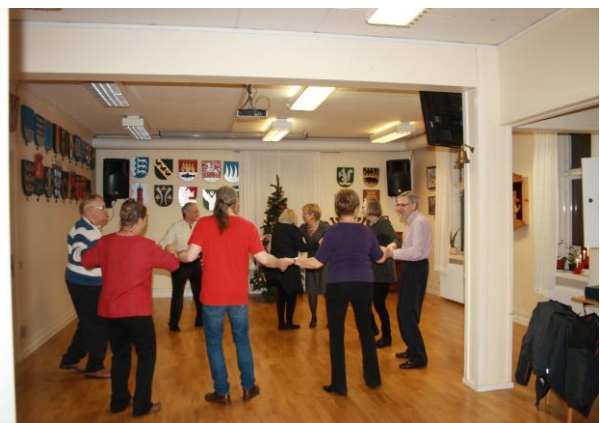
HOS OSS FINNS DET KONFERENS & FESTLOKALER