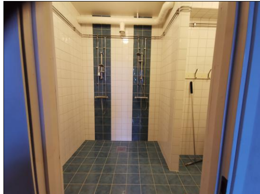
BASTU, DUSCH OCH RELAX