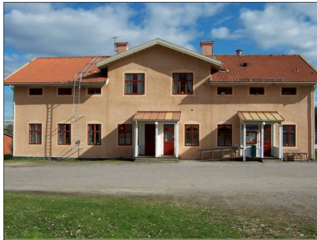
HYR AV FINSKA FÖRENINGEN