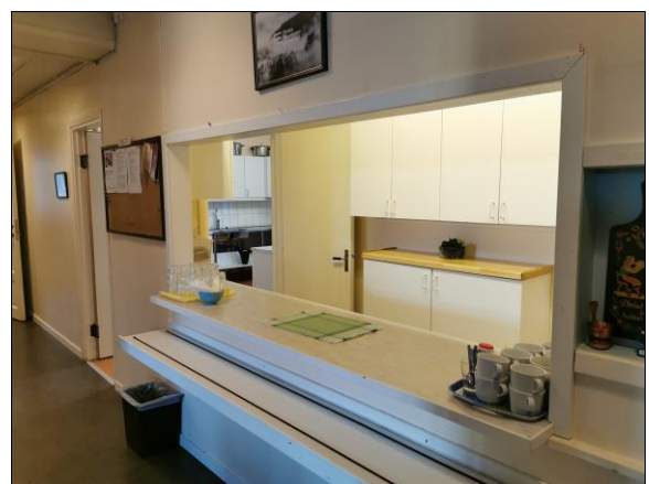
STORT MODERNT KÖK