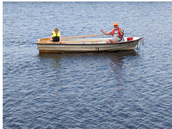
Kanootteja ja veneitä sai lainata. Jotkut kokeilivat kalaonneakin ajan kuluksi.