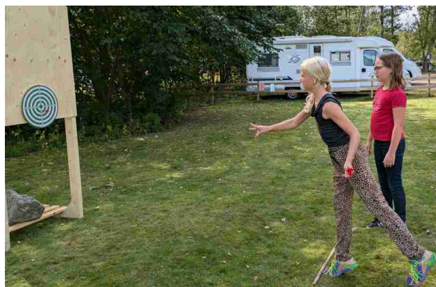
Tikka lentää lähelle napakymppiä

Sisällä sai laulaa tai piirustaa, mutta hieno ilma ulkona veti kansan nurmikolle.