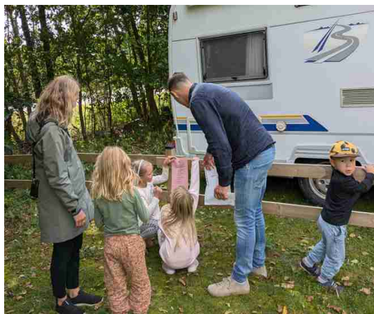
Oikeat vastaukset koko perheen voimin