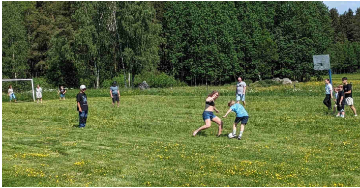
Jalkapallo viihdytti kaiken ikäisiä ja peli-intoa riitti. Uimataitoakin kokeiltiin kesäisen auringon lämmittä- mässä vedessä laiturin nokalta.