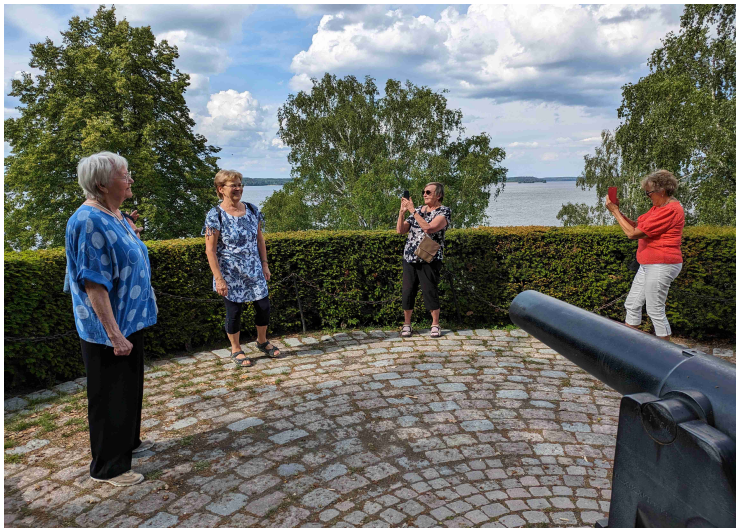
Paljon oli kuvattavaa ja väliin kuvasimme toisiamme

Me varasimme kaksi tuntia ja lopussa meni silti juoksuksi. Tosin suurin syy kiireeseen oli Vårdshusiin varattu lounas. Siellä aurinkoisella terassilla nautimme ja rupattelimme.