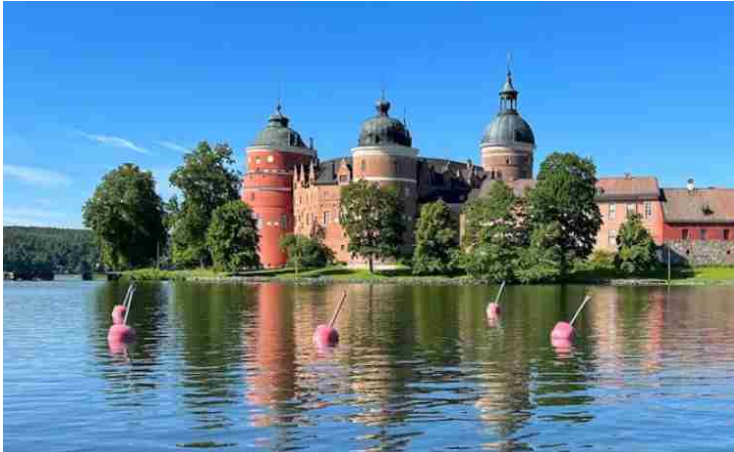
Tältä se näytti ruokapaikalta katsottuna.