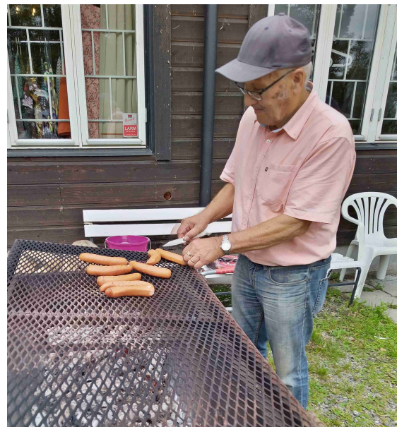
Myös makkara kuuluu hyvään kesään. Niitä grillattiin reilut 300 kesän juhlissa yhteensä.