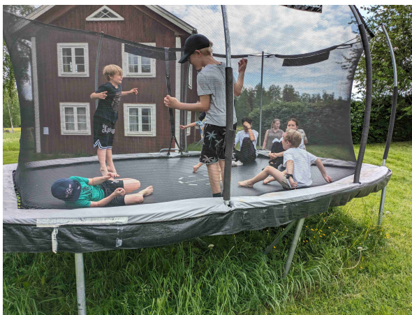
Hyppiminen, pomppiminen ja varsinkin yhdessäolo ovat lapsista mieluisaa.