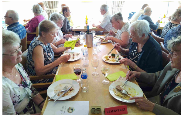
Ruokaa riitti vaikka ähkyyn asti

Alkukesän laivamatka Eckerön saarelle Ahvenanmaalle oli melkein täysin onnistunut. Ainoa vika oli bussin mikrofonissa, joka pysyi hiljaisena koko matkan ajan. Meitä oli täysi lasti ja niin saimme kyydin Suomituvalta ja illalla takaisin. Erittäin käytännöllinen tapa päivän matkoille. Grisslehamnissa bussi odotti meitä satamassa. Pakko niin, koska kuski oli mukana laivalla.