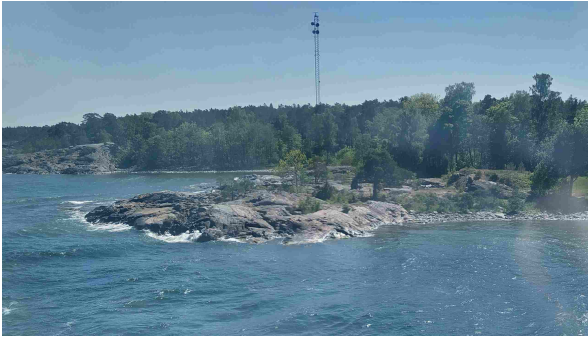
Karulta näytti Suomi laivan kannelta kuvattu

Laivalla osa porukasta katosi omille teilleen. Suurin osa taxfree ostoksille. Ruokaa odotellessa kerroimme vitsejä, pelasimme korttia ja keskustelimme muistellen menneitä ja arvioiden tulevaa.