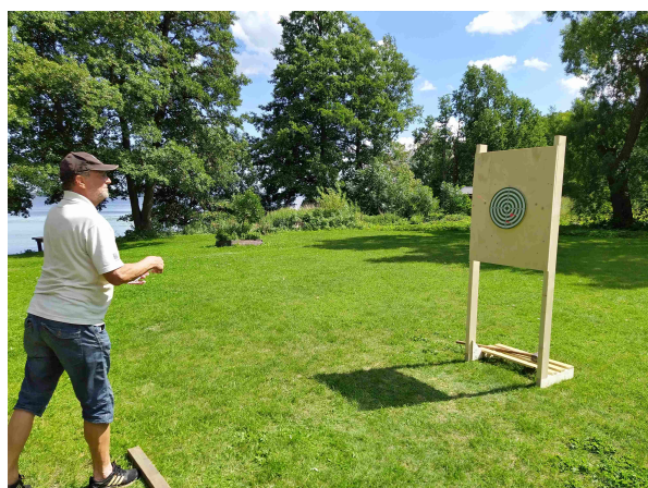
Allan heittää tikat tauluun

Katajainen kansa käytti tilaisuutta hyväkseen ja kirmaisi Suomirannalle leikkimään heinäkuun harvinaisena poutapäivänä. Tietenkin grillattiin makkaraa ja seurusteltiin. Karaoke pauhasi sisätiloissa vielä pitkälle puoliyöhön.