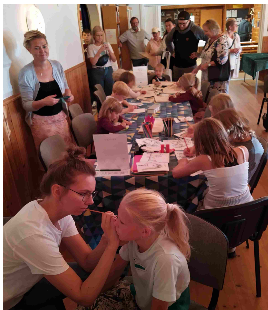
Lapsilla oli paljon touhua.