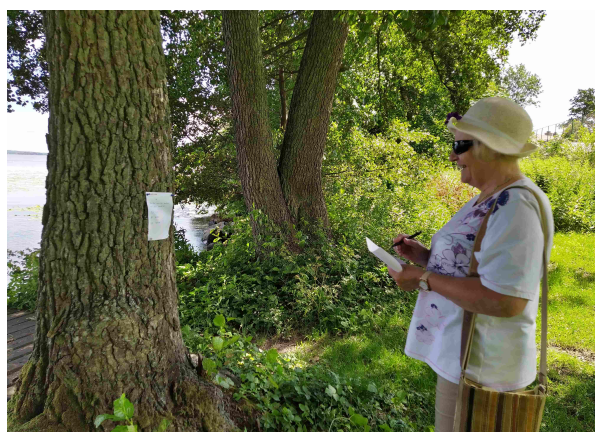
Aila vastaa oikeisiin kysymyksiin