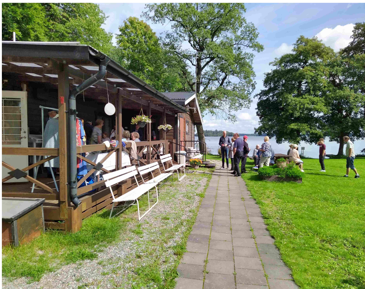
Kaunis Perhepäivä Suomirannalla