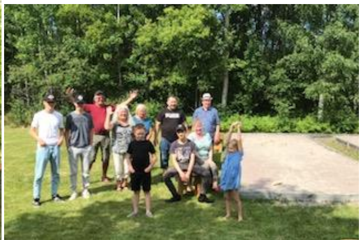
Mörkynpelaajat yhteiskuvassa. Paljon erilaisia pelejä.