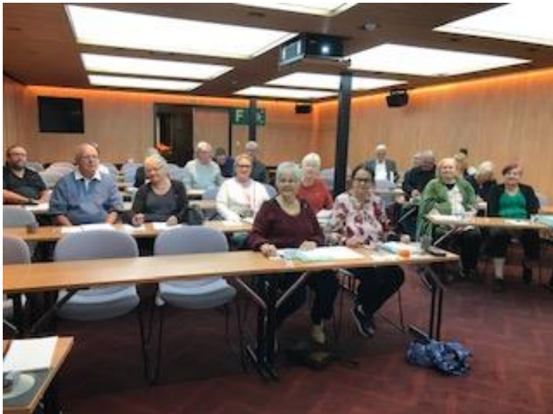
Piirin kurssilla laivalla