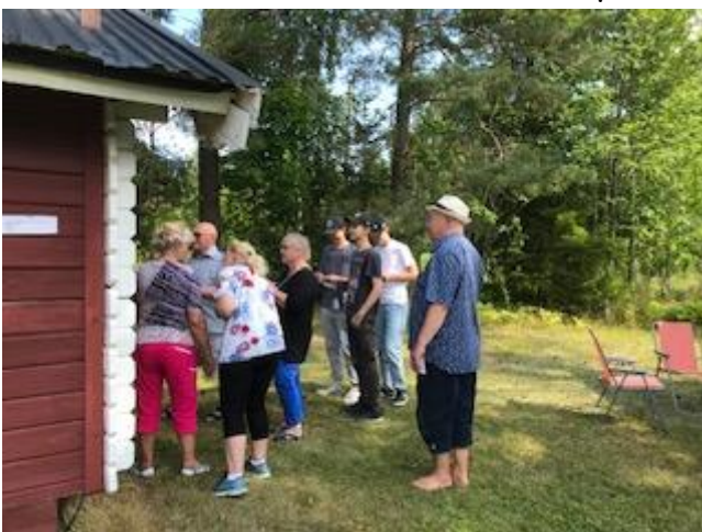
Veikkaukävely Kesäfestivaalissa Hanåsenissa

Seurastamme osallistui aika monta piirin Kesäfestivaaliin Gävlen Hanåsenissa.