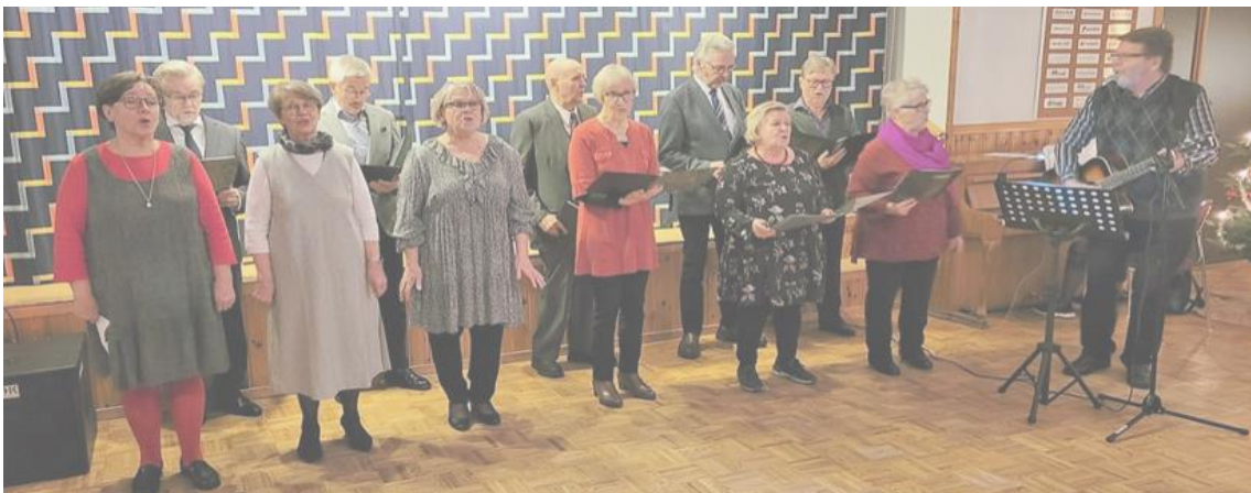
Mettäläisillä näyttäisi olevan niin suut supussa, että taitaa olla menossa ”Lehmän joulu”.