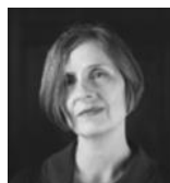
Susanna Alakoski & Nino Mick

Paikka: Skövden kaupunginkirjasto, Skövde. Rajoitettu määrä lippuja.