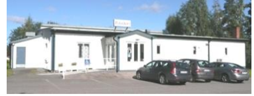
Tervetuloa Finnhoville, Skövdeen

TIISTAI: Kahvilatoiminta 20/10 klo 14.00-16.00.