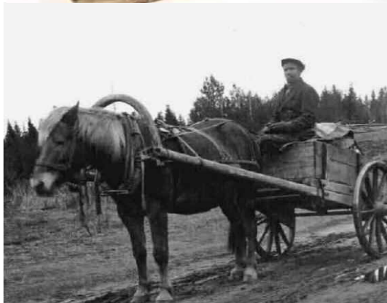
Kessu ja isäntä