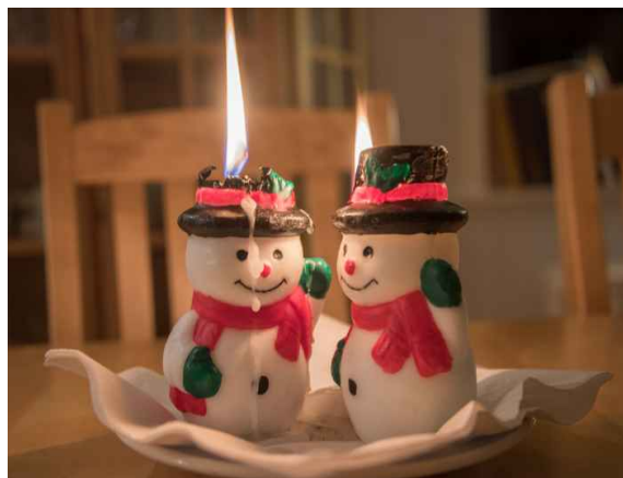
Luonnollinen tuli lepattaa rauhoittavasti, mutta Led lamppu on turvallisempi