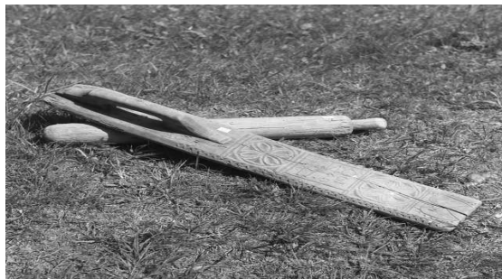
Kaulin oikaisi kurtut