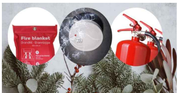
Sammutusviltti, opettele käyttö ajoissa. Palohälytín, tarkista patterien toimivuus Pulverisammutin, kevyt ja helppo käyttää