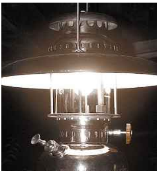
Tilley iltojen valo