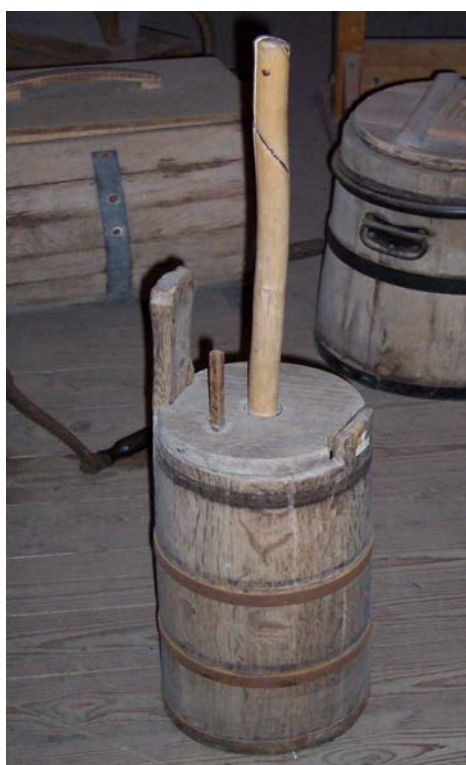
Kirnu ja taikinanjuuri